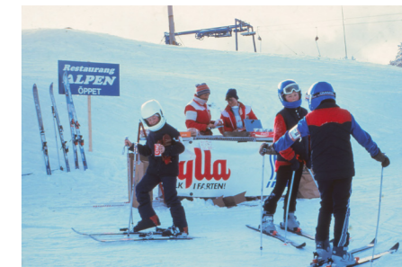
"Men vad ska vi med en större restaurang på sydsidan till? Det funkar bra det här. Folk vill inte ha finmat, det räcker med körv ö cola".

av Västbacken, Järvsstupet och Västliften. 1989 byggdes ett nytt gästhus.