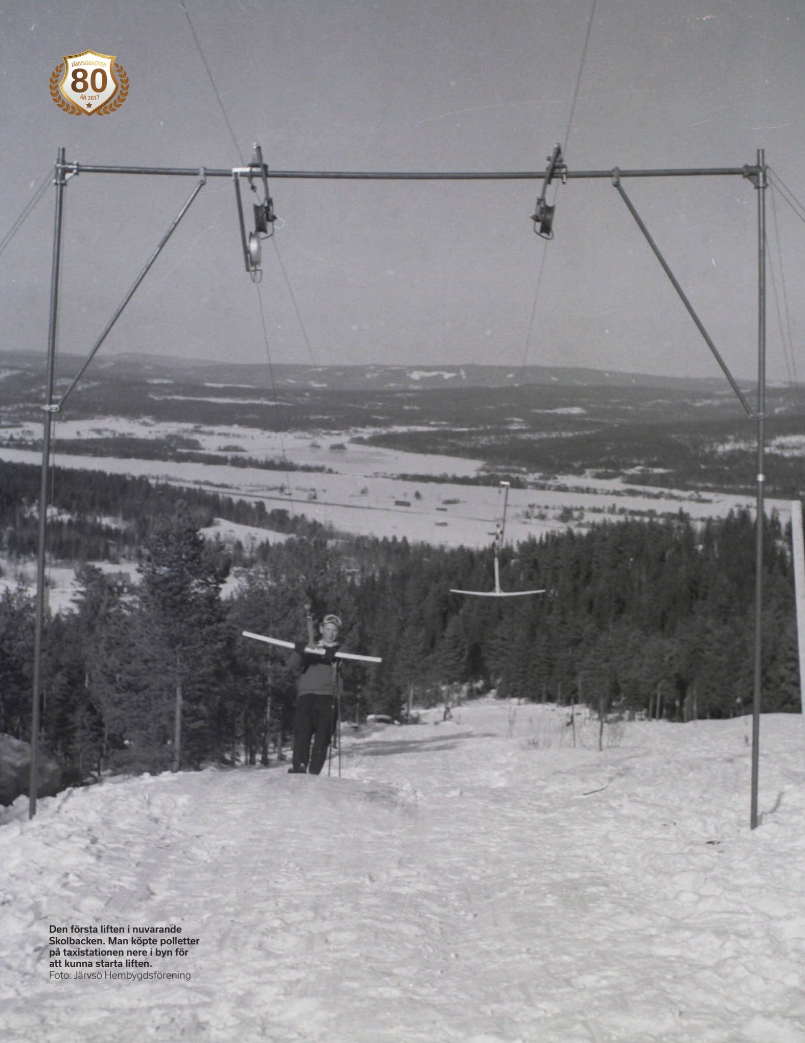
Den första liften i nuvarande Skolbacken. Man köpte polletter på taxistationen nere i byn för att kunna starta liften.

Den här bilden är riktigt gammal. Den är så gammal att vi blev tvungen att scanna in den från en glaskopia. Vi vet inte vilka som är på bilden, men det skulle kunna vara Olle Arvidsson.