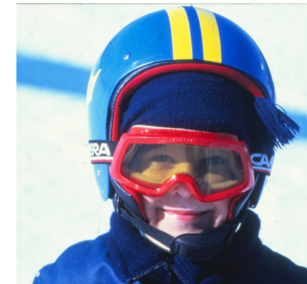
Alla har vi känt obehaget av knölig mössa under hjälm och isande hakfodral i plast.

ÖJEBACKEN BLEV SEDERMERA Järvsöbacken i mitten på 80-talet och lockade 20 000 besökare. Järvsö som by började åter blomstra. Hotell, butiker och restauranger gled med på framgångsvägen. Dick Helander gick i bräschen och 1986 byggdes fler nedfarter och liftar i form